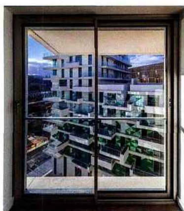
Unik. Les baies mettent en scène la générosité des vues.

J'essaie de traiter l'apport de lumière et le jeu avec l'obscurité nécessairement