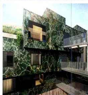
Béton marbré et ouvertures XXL (Schüco) pour l'hôtel 5* Parister récemment livré à Paris. © Beckmann-N°Thépé.

en béton projeté-sculpté du bâtiment principal – soit des « boîtes » vitrées de 8 m de haut comme serties dans un rocher –, d'autre part en continuité des volumes de la partie basse, de métal et de verre, en dialogue avec l'eau des douves. À Billancourt, le traitement est beaucoup plus classique – on est dans du logement – mais on a précisément fait attention à ce que le bâtiment soit très tramé, ainsi que sa vêtue extérieure, à base de panneaux de verre sur une isolation par l'extérieur, ce qui a simplifié la mise en œuvre du projet. La lumière, c'est ce par quoi l'espace et la matière deviennent lisibles, c'est le détecteur de vie et de poésie, qui n'a rien à faire avec les impératifs en termes de pourcentages d'ouvertures !