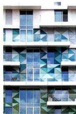
Géométries combinées des ouvertures et des vitrages colorés en parement.